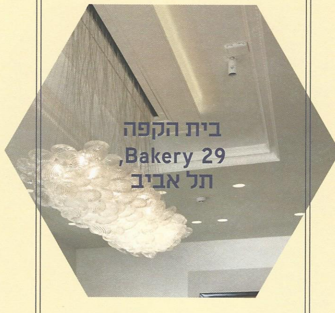
בית הקפה Bakery 29 תל אביב

רצפת המקום מימיה הראשונים של העיר תל אביב, העניקה השראה לעיצוב העתיק-חדש של המקום